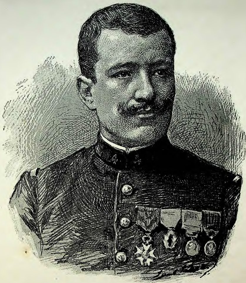
Le Lieutenant VOULET